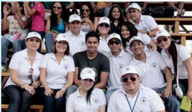
Integrantes del Departamento de Marketing y Comunicación Institucional de la Junta, junto con el Seleccionado Ecuatoriano Cristhian Noboa.