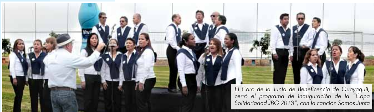
El Coro de la Junta de Beneficencia de Guayaquil, cerró el programa de inauguración de la "Copa Solidaridad JBG 2013", con la canción Somos Junta