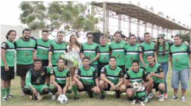
La designación al equipo mejor uniformado recayó en RTS