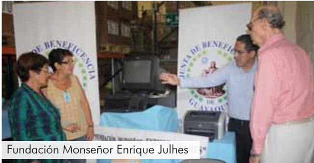
Fundación Monseñor Enrique Julhes

Cuatro instituciones de ayuda social recibieron la donación de medicina e implementos médicos, que permitieran mantener su labor en beneficio de los que más lo necesitan.