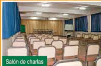
Salón de charlas

Devuélveles la alegría y diversión que ellos te dieron