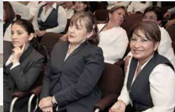
En la gráfica, se aprecian algunos de los asistentes al evento, los que acudieron en gran número a esta importante cita.