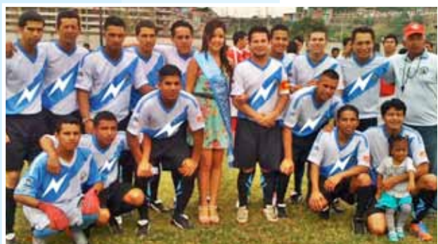
Integrantes del equipo de fútbol de la Junta de Beneficencia de Guayaquil durante la mañana deportiva.