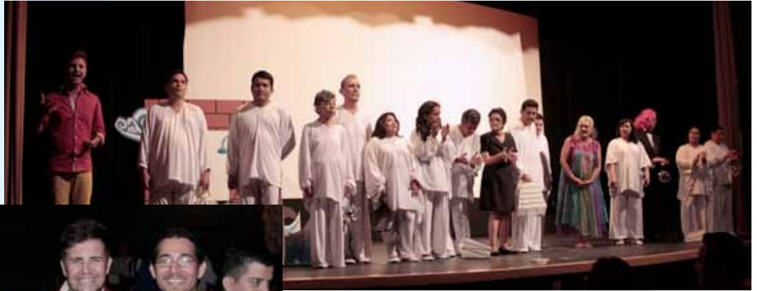
Integrantes del elenco Teatral Soñar Soñar, durante la presentación de la Obra "Tres Mares".