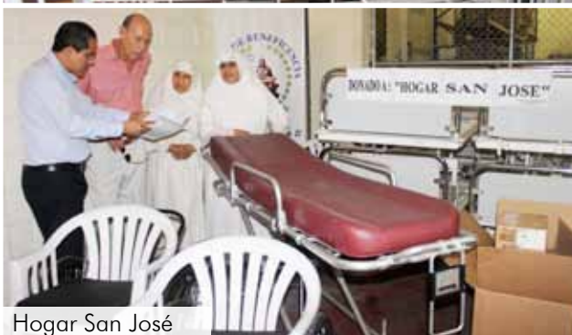
Hogar San José

La Fundación Panidis, que atiende a niños con capacidades especiales; recibió 11 cunas metálicas, que servirán para beneficiar a 11 niños de diferentes familias del cantón Mocache, Provincia de Los Ríos.